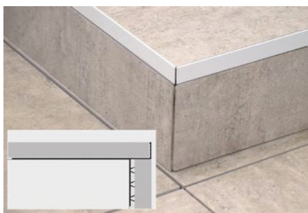
18. Slutresultat med T-Profil (ej lagervara)