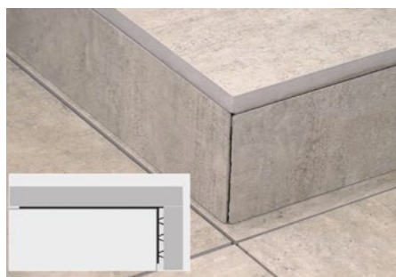
19. Slutresultat med N- profil (lagervara)